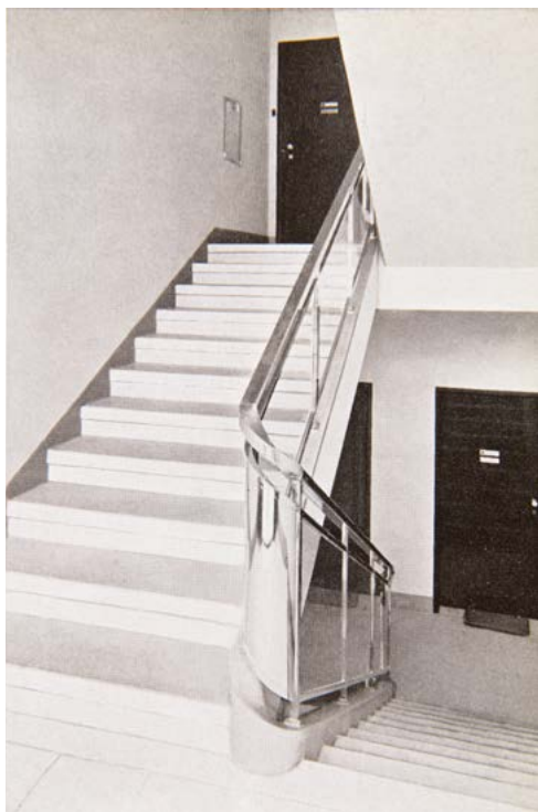
OBR. 7: Interiér činžovního domu, Soukenická 11, Praha.

Pro Katonův vyzrálý styl třicátých let jsou typické hladké omítky, specifické členění oken, důmyslně řešená nároží, promyšlené půdorysy a vhodná volba jednotlivých materiálů. Celkový výraz staveb je velmi moderní, příležitostně Katona používal i pásová okna — charakteristický znak funkcionalismu, což je pro „pražskou německou“ architekturu výjimečné. Prager Presse referuje o architektově tvorbě v roce 1938 slovy: „Jsou to ty vkusné stavby, které i přes jednoduchost své formy přitahují pozornost použitím materiálů vhodných k dílu a nesou punc osobnosti svého tvůrce v charakteristických hladkých fasádách“ (l.b. 1938; přel. L. K.).