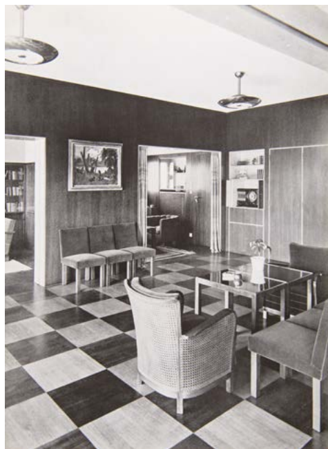
OBR. 2: Interiér bytu Klimentská 6, Praha.