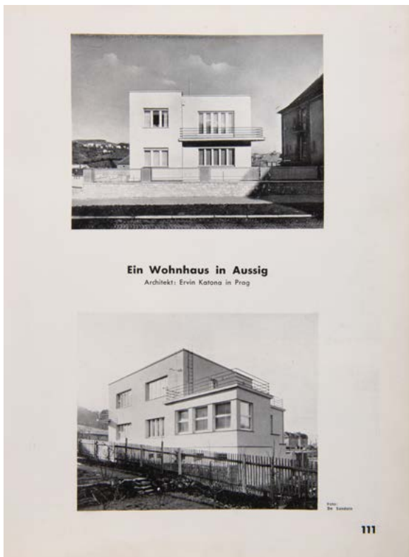
OBR. 1: Vila v Ústí nad Labem.

stejně edici vyšly i dvě monografie dalšího židovského německy mluvícího architekta Bertholda Schwarze, který v meziválečném období rovněž působil v Praze.