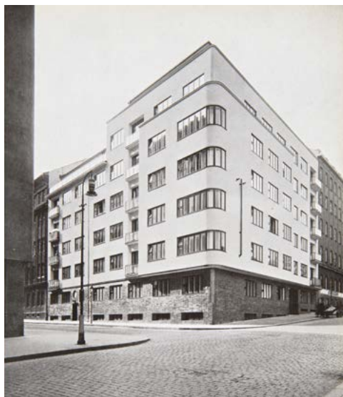
OBR. 6: Činžovní dům, Veletržní 29, Praha.