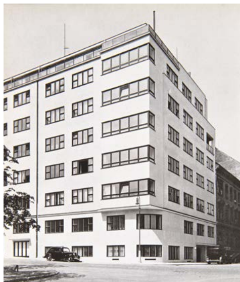
OBR. 5: Činžovní dům, U Studánky 1, Praha.